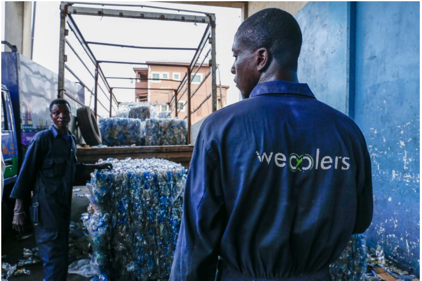
Members of the WeCyclers recycling team load bails of plastic onto a truck at the main hub in Ebute Metta, Lagos, Nigeria on Thursday 14th March 2019.

L'entreprise a aussi été sélectionnée pour son impact économique. Les ménages qui donnent leurs déchets à WeCyclers récoltent des 'points' qu'ils peuvent échanger contre de la nourriture, des articles ménagers, des produits alimentaires ou de l'argent liquide. L'initiative permet ainsi à des ménages à faibles revenus de tirer profit de leurs déchets.