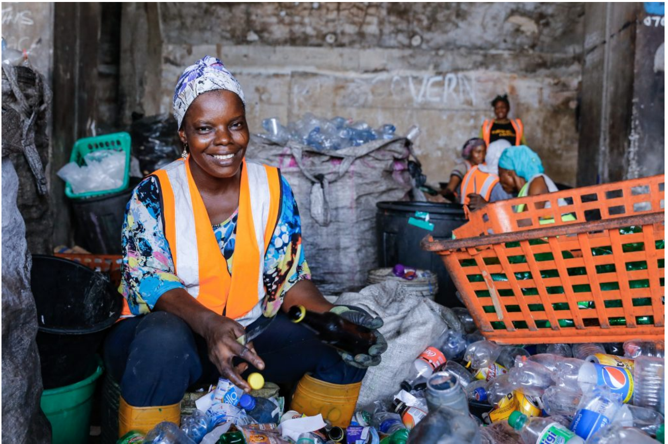
A member of the recycling team sorts plastic bottles at the WeCyclers main recycling hub in Ebute Metta, Lagos Nigeria on Thursday 14th March 2019.

L'entreprise compte aujourd'hui plus de 17.000 adhérents dans 7 quartiers de Lagos, et enregistre chaque mois 200 nouveaux clients. La start-up nigériane a aussi créé 200 emplois en 7 ans, majoritairement pour des femmes qui représentent actuellement 60% de son personnel.