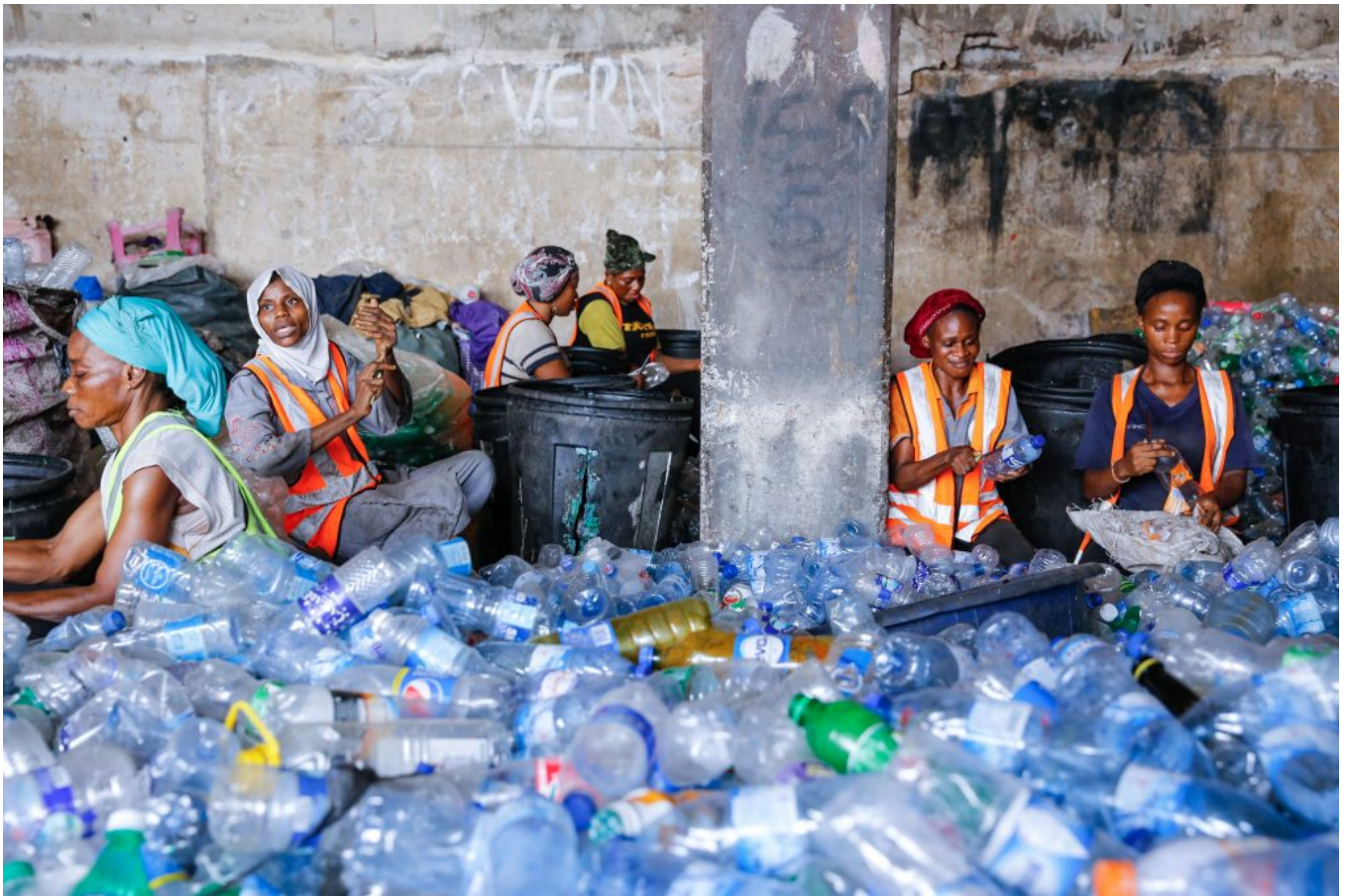
Sorters at WeCyclers prepare plastic bottles for bailing at the recycling hub in Ebute Metta, Lagos Nigeria on Thursday 14th March 2019.